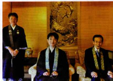
(御門主との記念写真 H31.1.11)