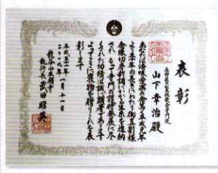
(本山からの表彰状 H31.1.11)