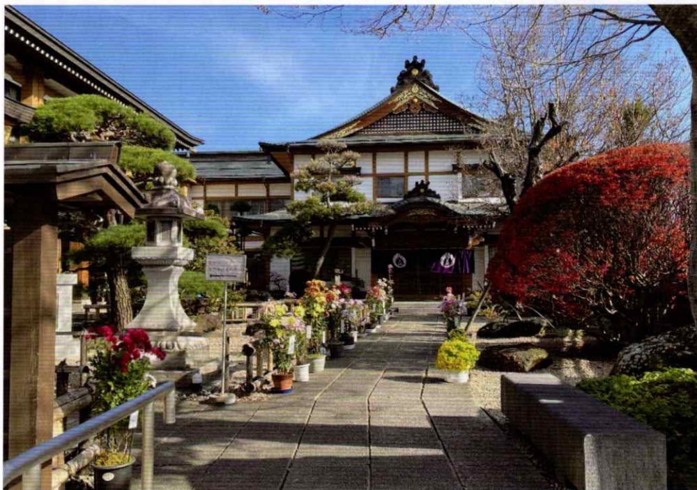
昨年の報恩講法要：菊鉢で皆様をお迎えした境内のようす(3.11.14)